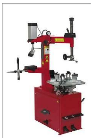
MASINA pentru DEJANTAT ROȚI