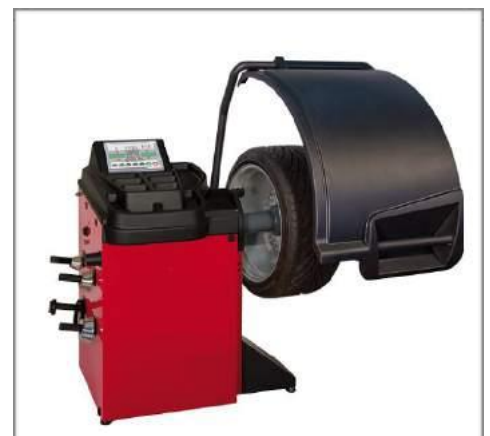
MASINA pentru ECHILIBRAT ROȚI