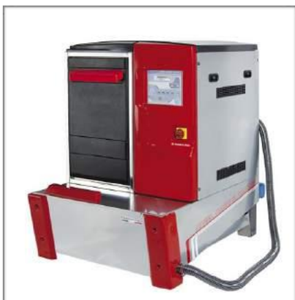
MASINA pentru SPALAT ROȚI