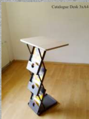
Cantitate: 1 buc.