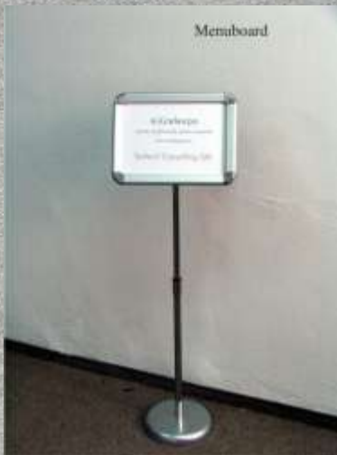
Cod produs: AF100 / AF101 Cantitate: 1 buc.