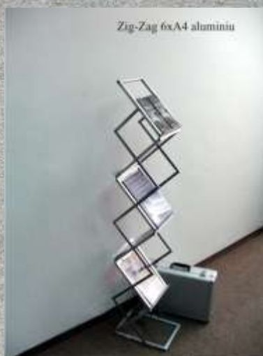
Livrare: in 1 zi (in limita stocului disponibil) Cod produs: BR050 Cantitate: 1 buc.