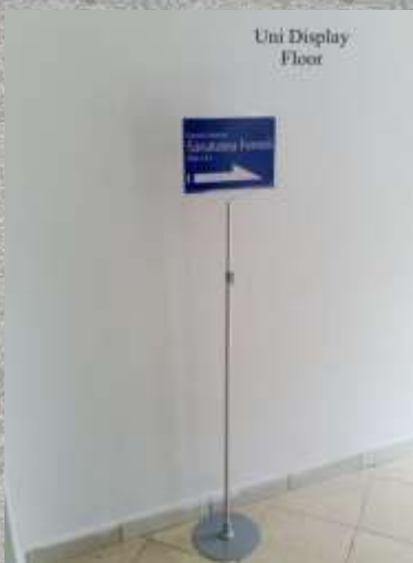
Cod produs: AF110 / AF111 Cantitate: 1 buc.