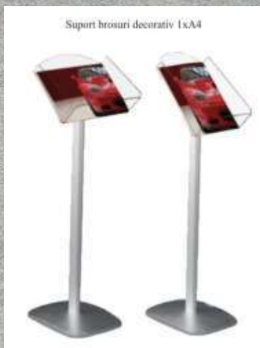
Cod produs: BR040 Cantitate: 1 buc.