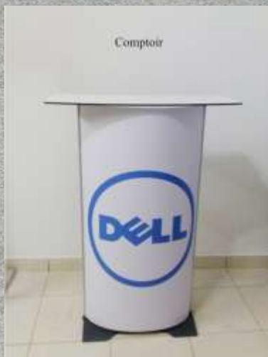
Cod produs: IN030 Cantitate: 1 buc.