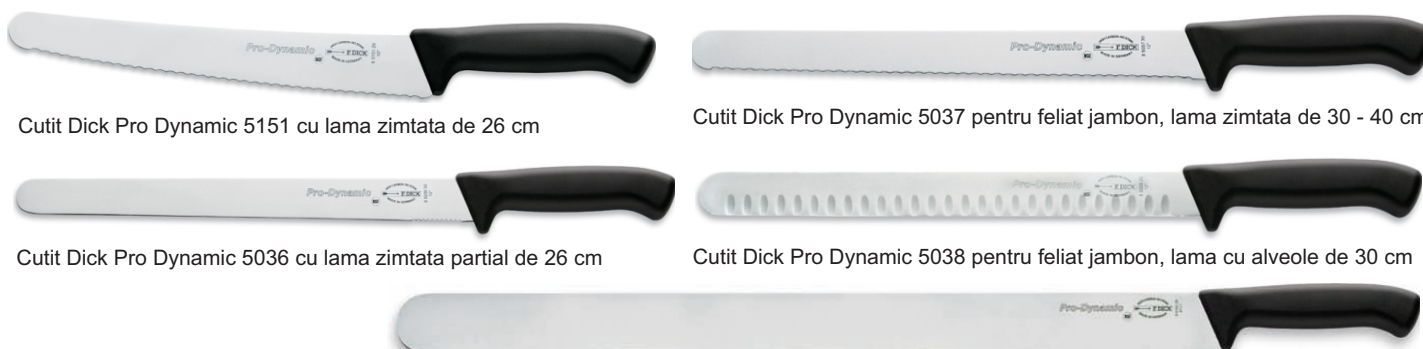
Cutit Dick Pro Dynamic 5151 cu lama zimtata de 26 cm