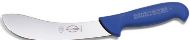
Cutit Dick 2264 pentru jupuit - lama 15 - 18 cm