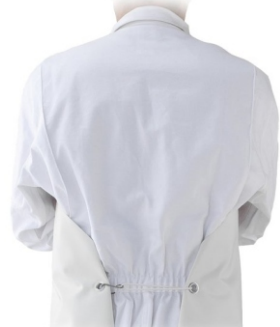
Prindere la spate standard, cu elastic si carlig inox