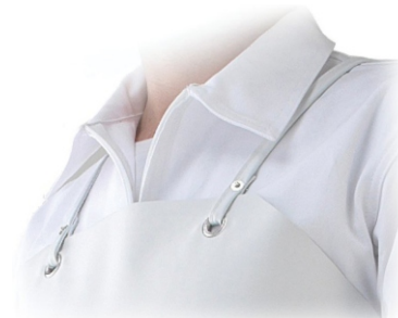
Prindere la spate in "X", cu bretea