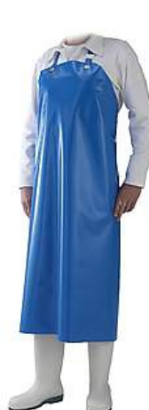
Sort albastru DELTA