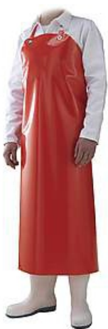
Sort rosu DELTA