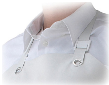
Bretea reglabila pentru adaptarea lungimii