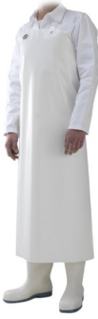
Sort alb DELTA - 90x115 cm Din poliuretan,prindere standard cu elastic si carlig inox