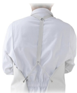
Prindere la spate harnais, cu bretea,elasic si carlig inox