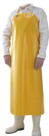
Sort galben DELTA