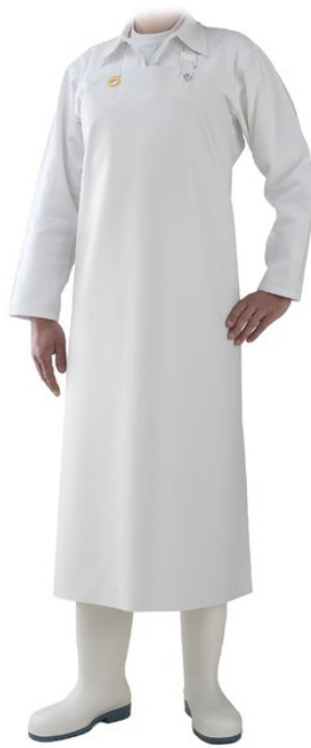
Sort alb LIMA - 90x115 cm Suport din material textil, cu fete din nitril