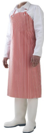
Sort HOTEL - 75x100 cm Suport din material textil,cu fete din PVC (alb,verde,albastru cu dungii albe)