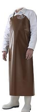
Sort maro DELTA