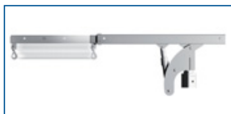
Telescop hidraulic (opțional)