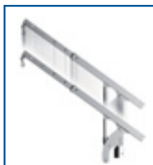
Catarg vertical hidraulic 600mm (opțional)