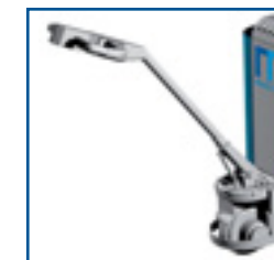
Tracțiune electrică (opțional)

Cinematică unică brevetată Mobilev – macara modulabilă