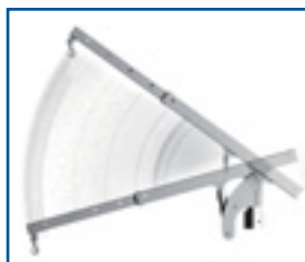
Înclinația brațului hidraulic (echipament de serie)