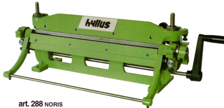
art. 288 NORIS