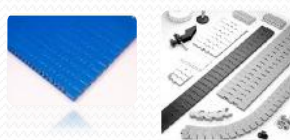
BENZI MODULARE LANTURI TRANSPORTOARE