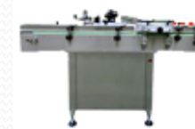
MASINI DE ETICHETAT