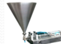
MASINI DE DOZAT LICHIDE VASCOASE SI SEMIVASCOASE