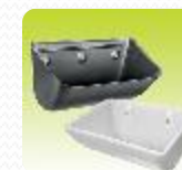
CUPE ELEVATOARE SNECURI