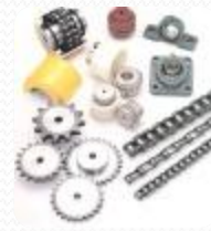
LANTURI PINIOANE LAGARE CUPLAJE