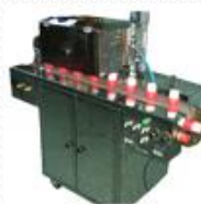
MASINI DE DOZAT SI UMPLUT TUBURI