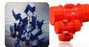
MOTOVIBRATOARE ELEMENTE ANTIVIBRATIE