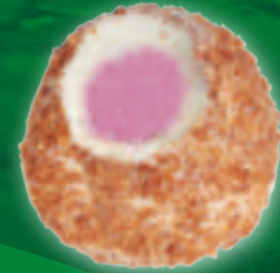
Mingi de prune