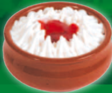
Frăguțe cu iaurt în ceramică