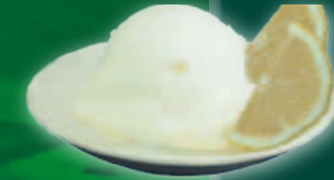
Lămâie 3,25 l