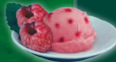
Zmeur 2,3 l