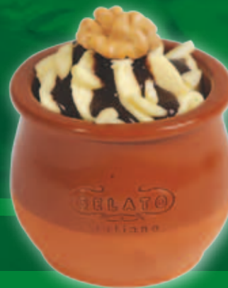
Vanilie în ulciă