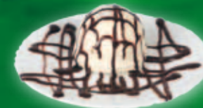
Parfe cu ciocolată