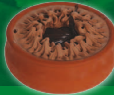
Ciocolată în ceramică