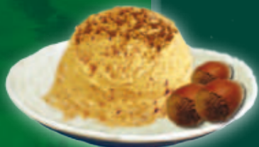
Alune de aur 2,3 l