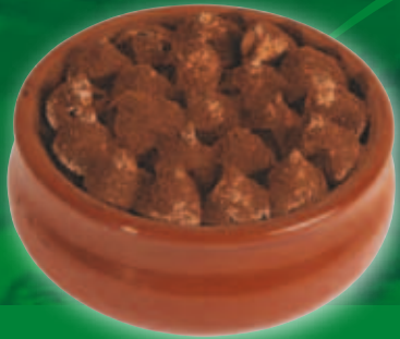
Tiramisu în ceramică