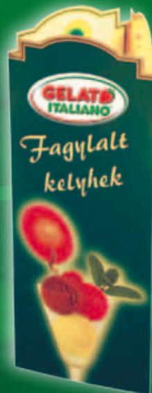
menu de cupe