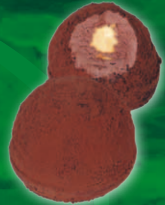
Tartufo cu ciocolată