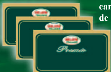
cartelă de gust