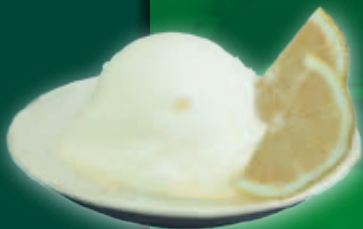
Lămâie 2,3 l