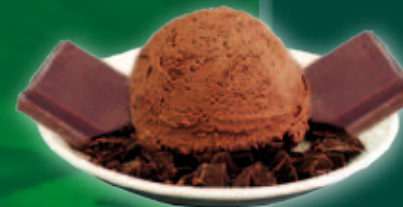
Ciocolata 2,3 l 4,75 l