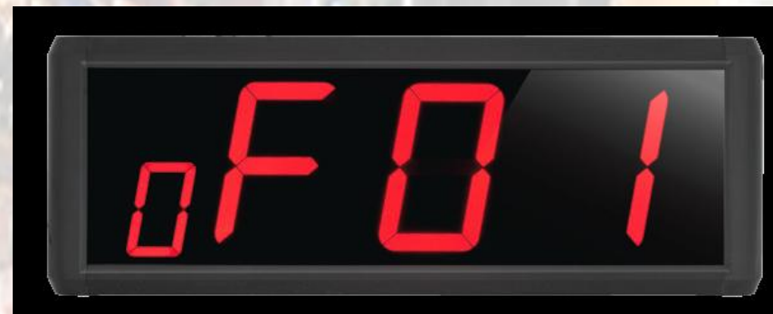
Y-310B (1185 lei)

Receptor fix cu indicare luminoasă și sonoră. Are o capacitate de 999 stații de apelare și o coadă de așteptare de 10 apeluri.