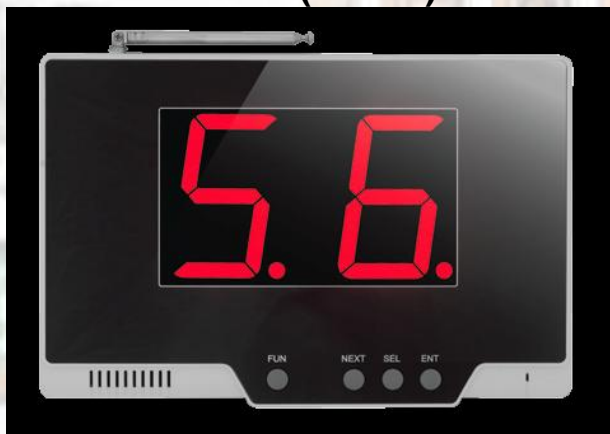
Y-99P (620 lei)

Receptor fix cu indicare luminoasă și sonoră. Are o capacitate de 99 stații de apelare și o coadă de așteptare de 10 apeluri.