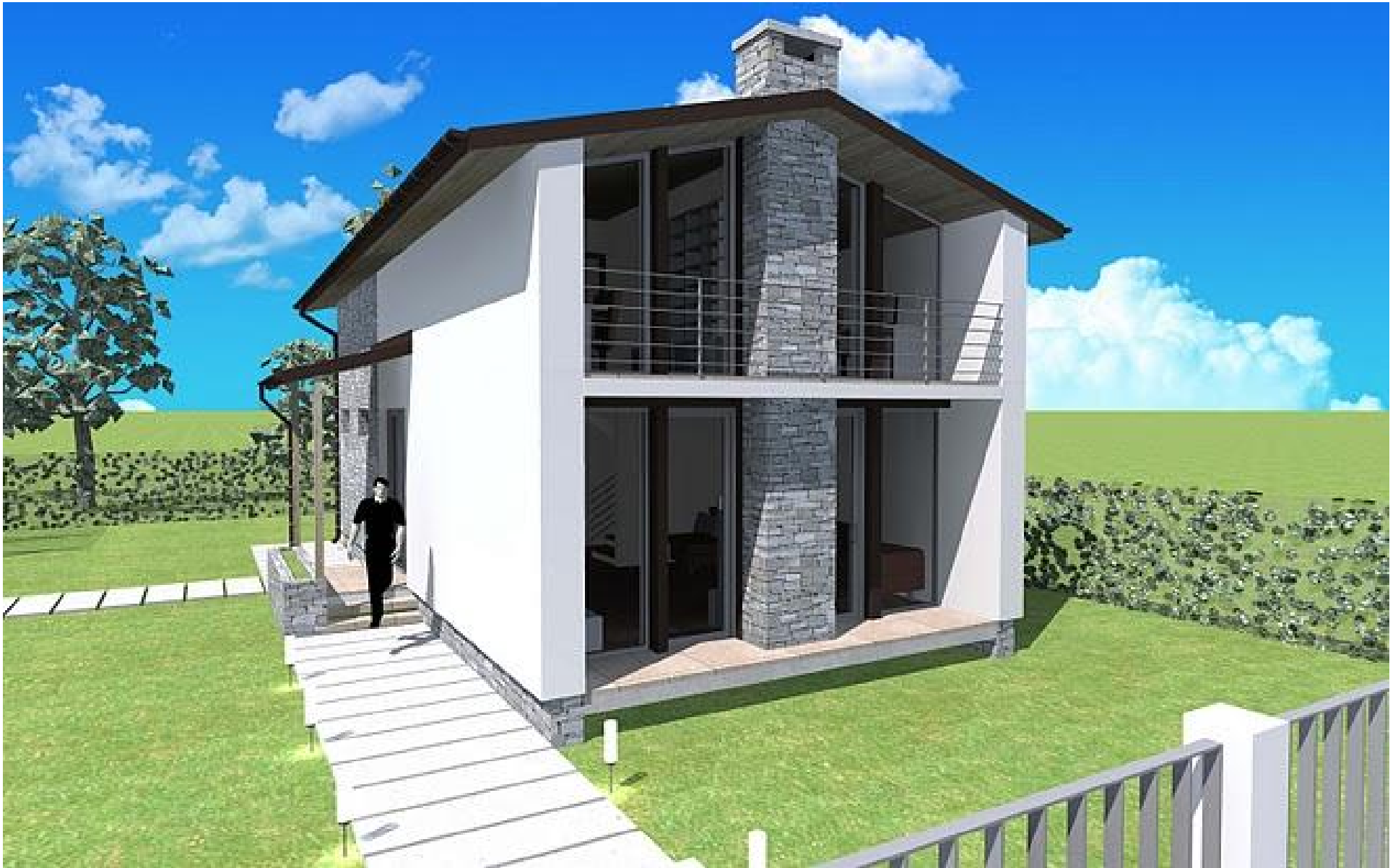
Casa P+M din caramida suprafata construita 142.66 mp, suprafata utila 110.70 mp