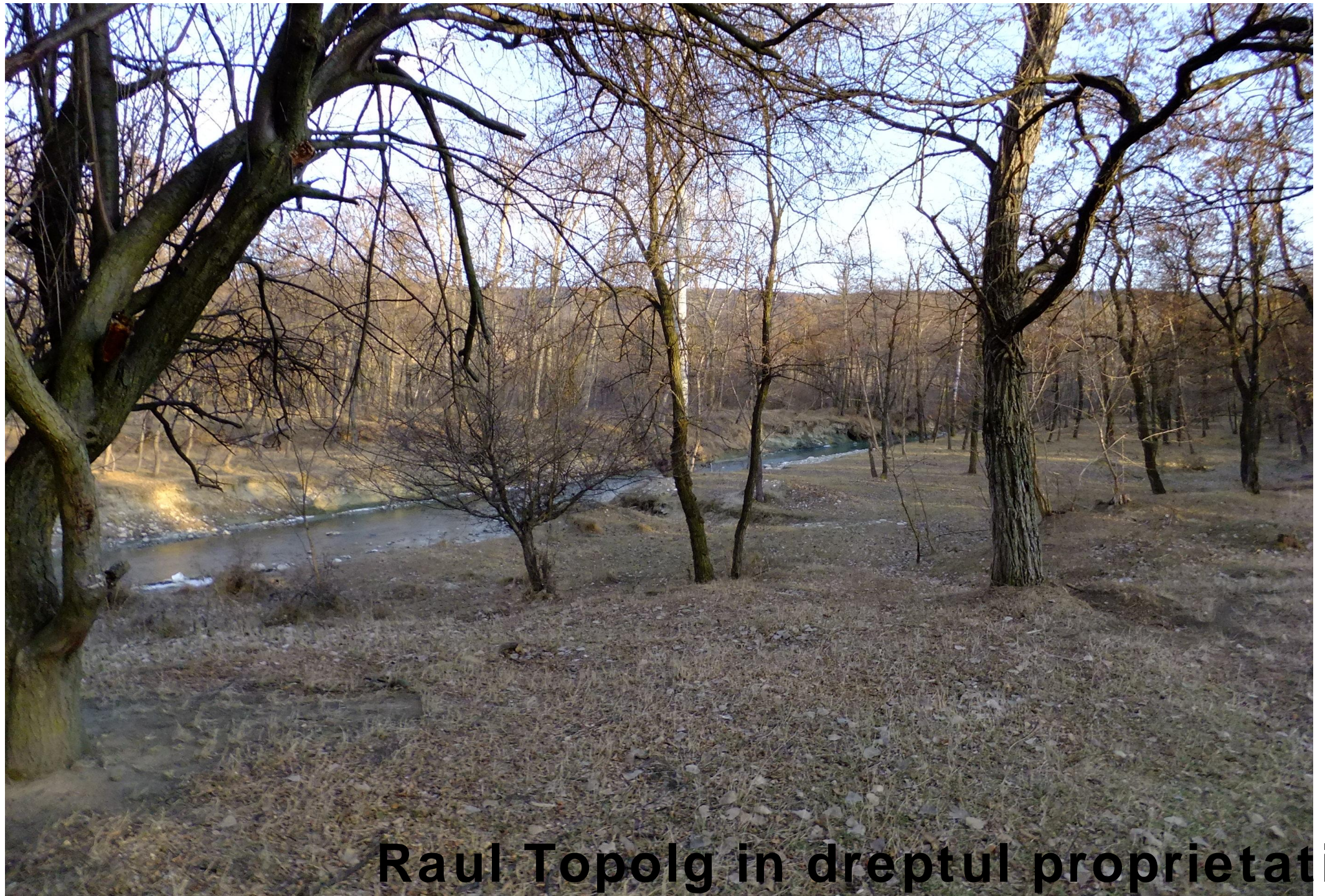
Raul Topolg in dreptul proprietatii