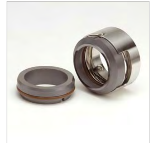
TABLEAU DIMENSIONNEL (Dimensions en mm. sujettes à variations ou modifications)

Garniture mécanique équilibrée, ressort ondulé, sens de rotation indépendant.