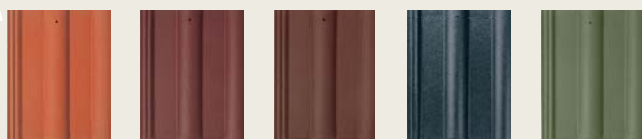
roșu cărămiziu* brun roșcat închis* maro antracit briliant verde