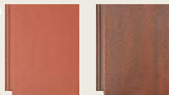
roșu cărămiziu antic