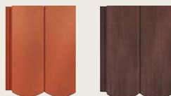
roșu cărămiziu antic