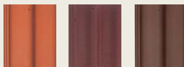
roșu cărămiziu brun roșcat deschis maro