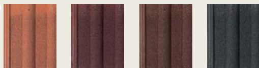
roșu cărămiziu brun roșcat închis maro antracit

SUPRAFATA PROTECTOR cu 4 factori de protecție