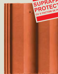
Prodot Bramac cu suprafața Protector®