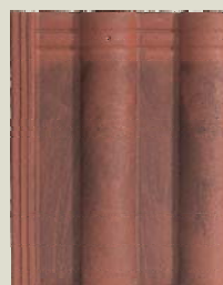
Prodot al unui competitor

Din portofoliul Bramac, modelele de țiglă Transilva, Alpina, Romana și Alpina Clasic sunt disponibile cu suprafața Protector®. Pentru detalii cu privire la culori și pentru mai multe informații consultați www.bramac.ro .