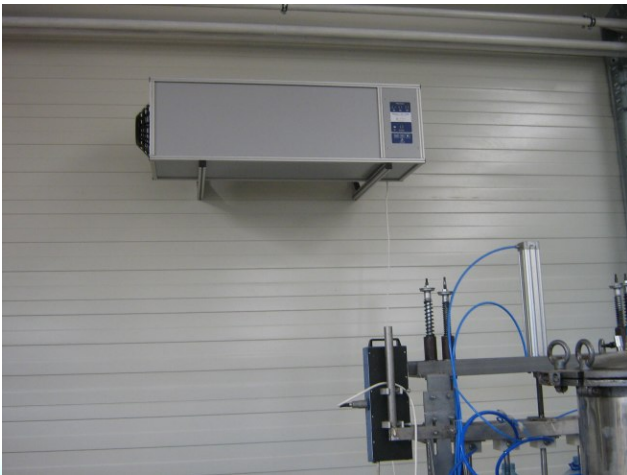
Imbuteliere apa minerala