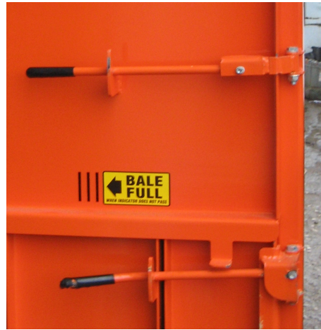
Siguranta muncitorilor asigurata prin blocarea mecanica a usilor cu sisteme foarte rezistente (modelele 2011)