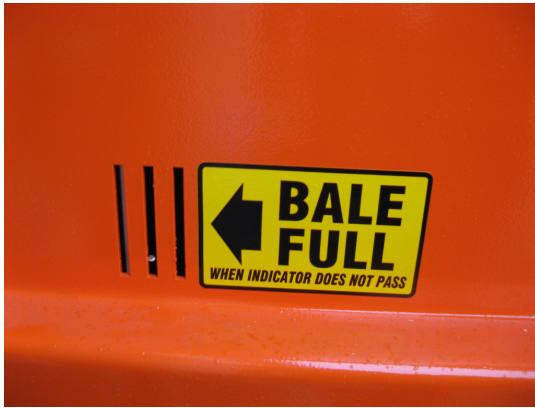
Indicator balot full