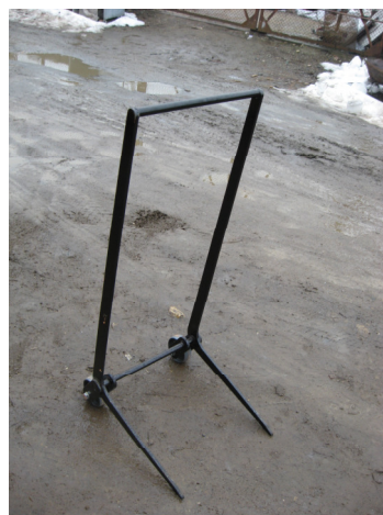
Caruciorul pentru scoatere Baloti