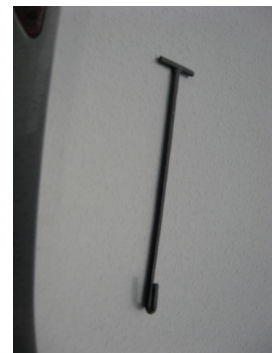
Carlig pentru tras banda din presa ( pentru evitarea accidentelor )