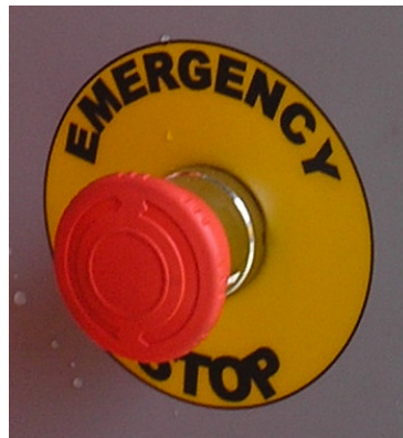
Ciuperca pentru oprirea masinii in situatii de urgenta