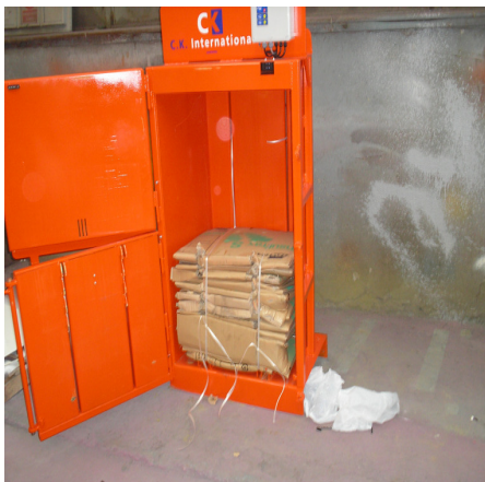
Presa cu balotul de carton