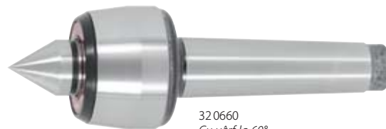
32 0660 Cu vârf la 60°.

32 0670 – Vârful alungit permite folosirea cuțitului de strung pentru prelucrarea frontală a piesei. Recomandat pentru strunjire prin copiere.