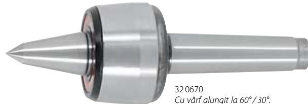
32 0670 Cu vârf alungit la 60°/30°.