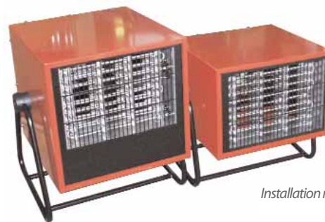
Installation murale uniquement