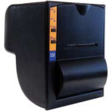
Imprimanta VEI FT190