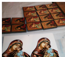
reproduceri opere de arta