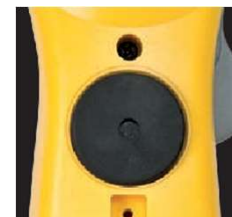
Built in Magnetic Hanger (SC260)