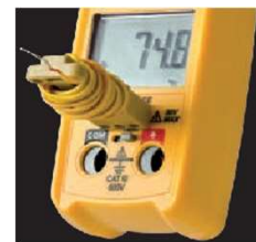
K Type Thermocouple Plugs Directly into Meter (SC240/SC260)