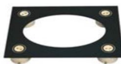
Dispozitiv pentru un vid de 3 ori mai mare optional)