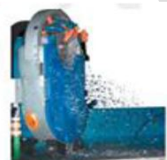
Sistem de plasare a utilajului pe perna de apa

Disponibil in varianta trifazic sau 220V. Pe perna de apa sau pe role.