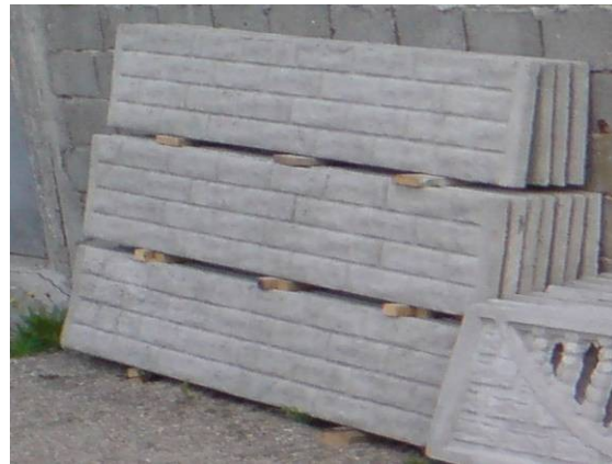
B2 = Placa baza 200x40 cm ==> 40 ron