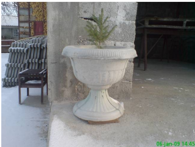
Dimensiuni: 50mm inaltime, Ø30mm = 70 ron