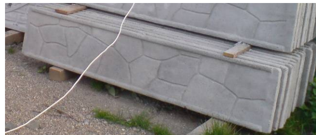
B1 = Placa baza 200x40 cm ==> 40 ron