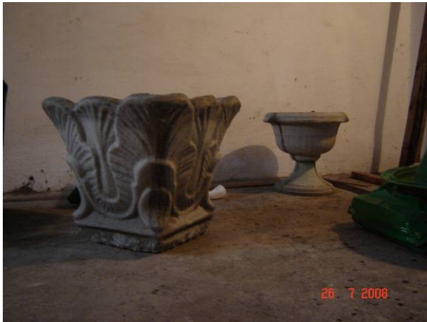
Dimensiuni: 60mm inaltime, Ø40mm = 80 ron