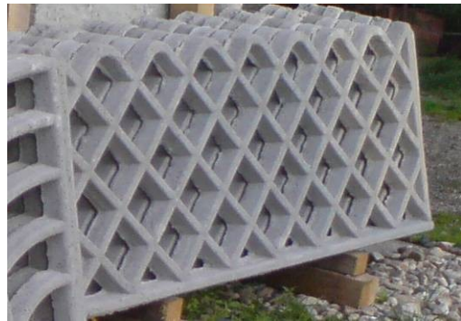
O3 = Placa ornament 200x80 cm ==> 60 ron