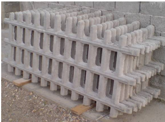
O4 = Placa ornament 200x80 cm ==>60 ron S1 = Stalp 250x13x14 cm ==> 50 ron