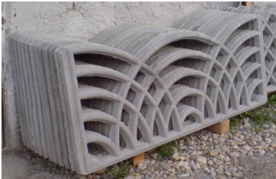
O1 = Placa ornament 200x80 cm ==> 70 ron

Va multumim pentru cererea dumeavoastra.