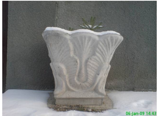
Dimensiuni: 60mm inaltime, Ø40mm = 80 ron