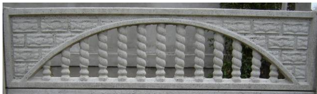
O2 = Placa ornament 200x50 cm ==> 50 ron