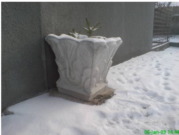
Dimensiuni: 60mm inaltime, Ø40mm = 80 ron