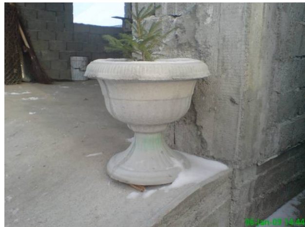
Dimensiuni: 50mm inaltime, Ø30mm = 70 ron