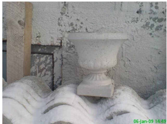
Dimensiuni: 25mm inaltime, Ø15mm = 30 ron