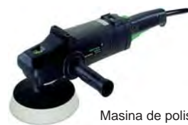
Masina de polisat Pollux 180 E