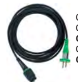
Cablul plug-it Cauciuc, 4,0 m; Tip: H 05 RN-F/4 Cod comanda: 489421 Cauciuc, 7,5 m; Tip: H 05 RN-F/7,5 Cod comanda: 489661