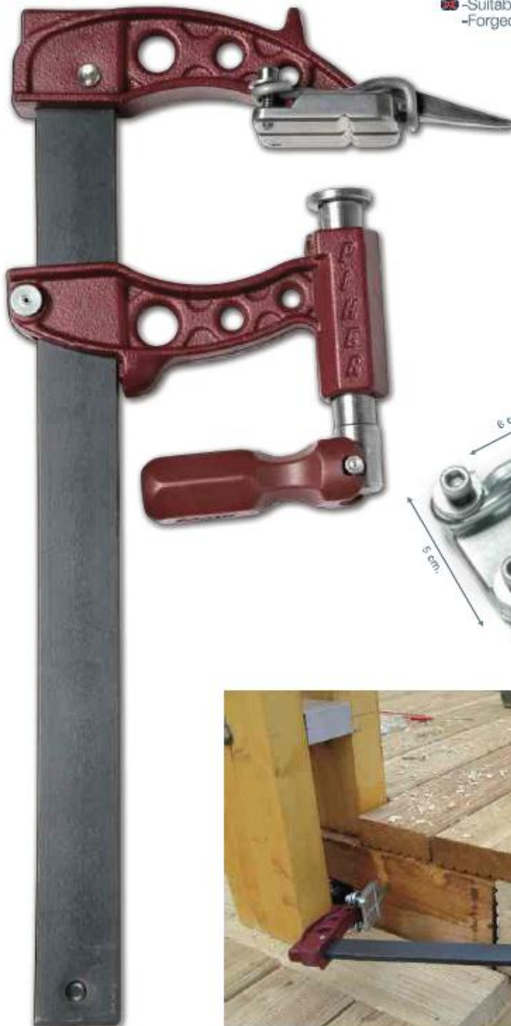
Accesorio Piolet Spike fix accessory