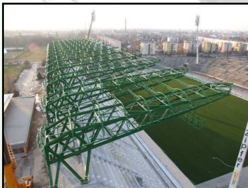
Stadion ETO Győr UNGARIA