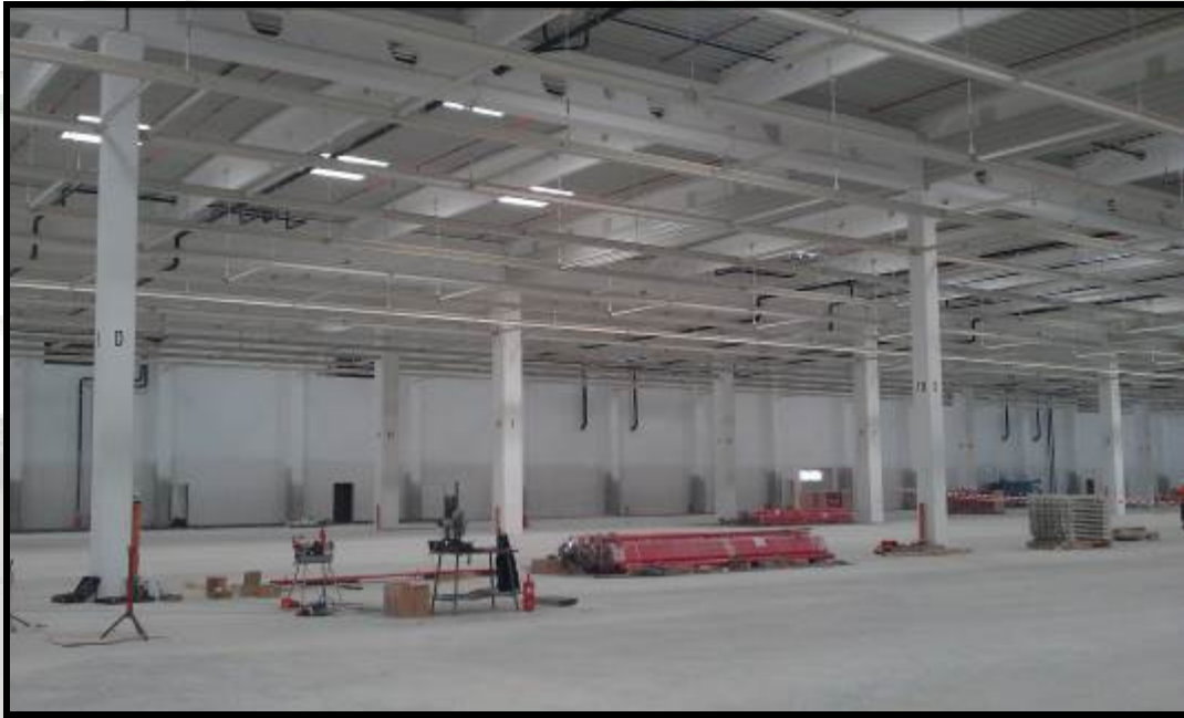
Montaj structura metalica tehnologica suspendata hala G20 - Audi Győr Ungaria (peste 210 to)