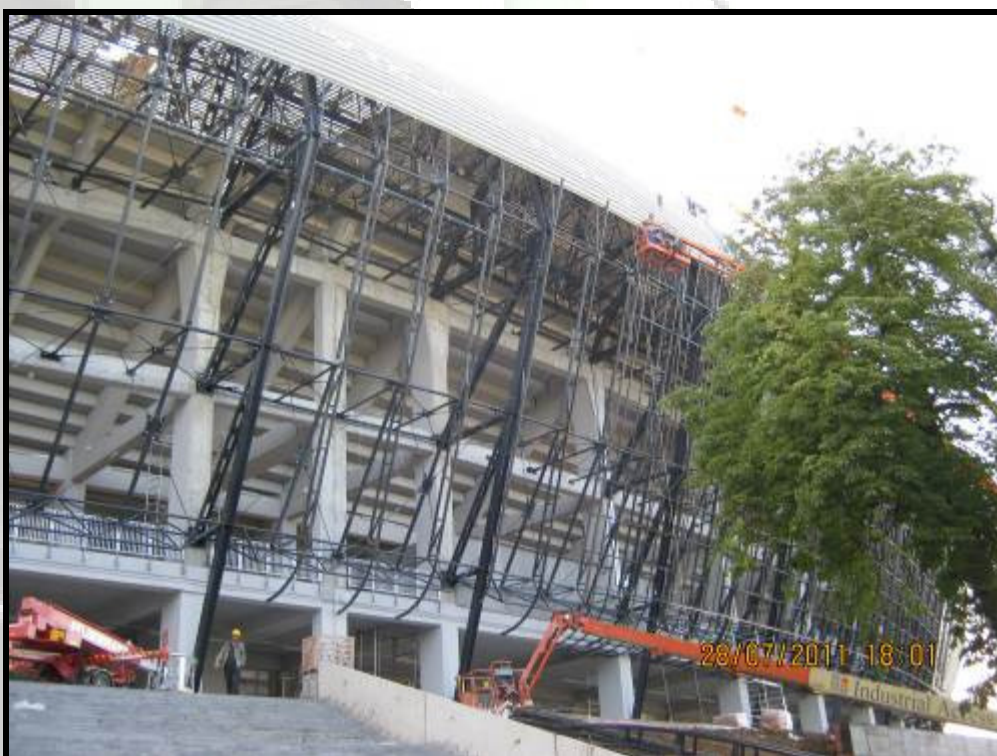
Montaj structura metalica principala si secundara la Stadion Municipal Cluj – Cluj Arena (peste 250 to)