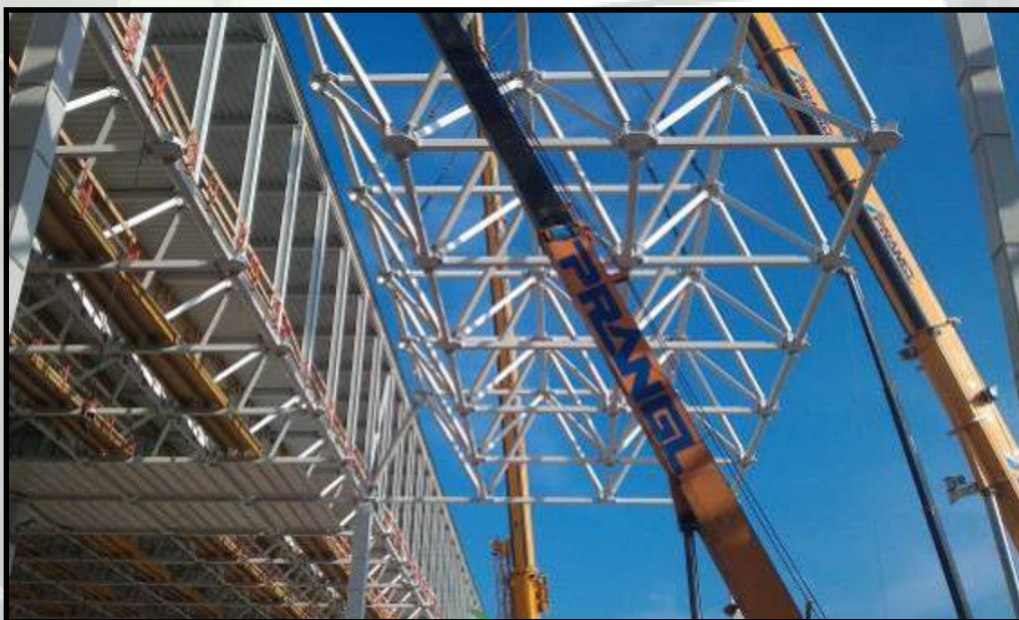
Montaj structura metalica sectie asamblare uzina Audi Győr – Ungaria (peste 700 to)