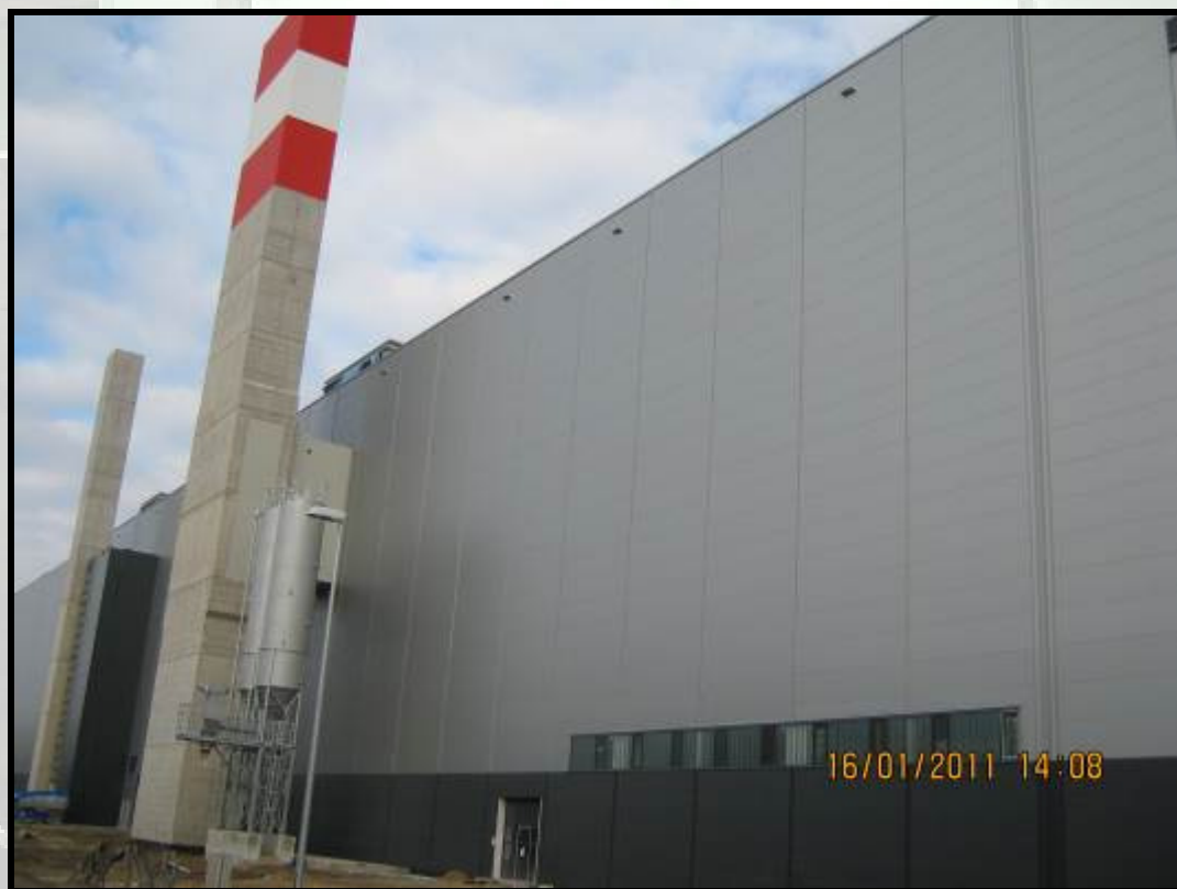
Montaj inchideri la uzina Mercedes – Sectia vopsitorie din Kecskemet – Ungaria