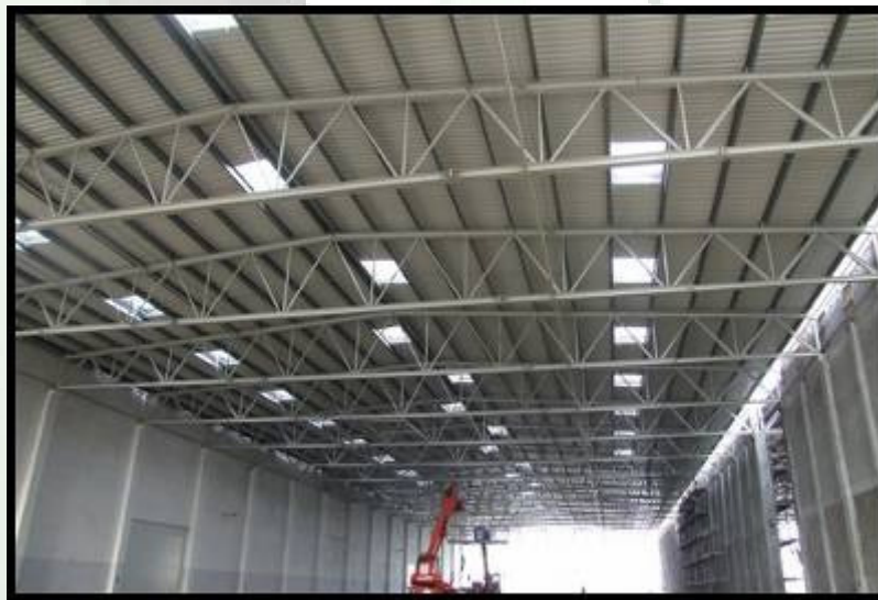
Montaj inchideri hala de productie Continental Timisoara – 10.000 m2 tabla de acoperis