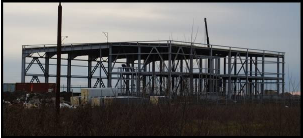
Montaj structura metalica RAR Timisoara – 150 t