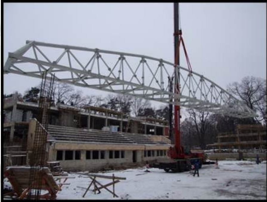
Montaj structura metalica speciala de acoperis la bazinul de innot al Universitatii Babes – Bolyai – 90 t