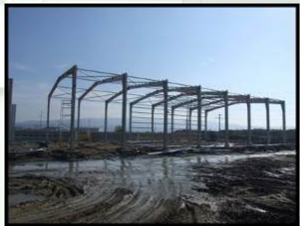
Montaj structura metalica birouri si depozit Irina Impex – Ramnicu Valcea – suprafata hala 2400 m2 si 330 t structura metalica