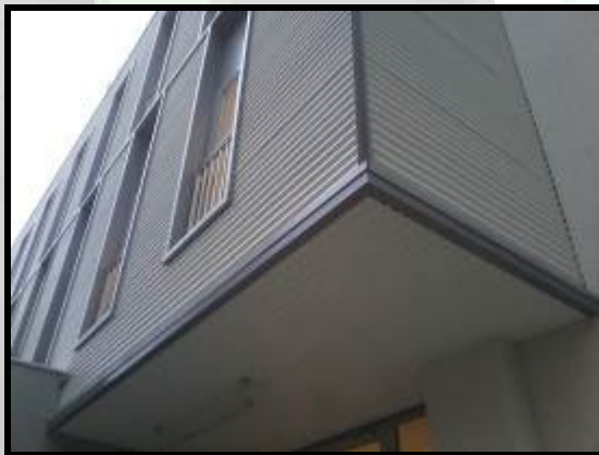
Montaj fatada din tabla sinus – Studio DIGI 24 Galati