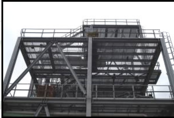
Structura metalica tehnologica BorsoChem Kazincbarcika UNGARIA