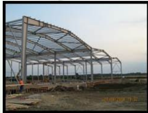
Montaj structura metalica Hermes Business Park Timisoara – aproximativ 450 t