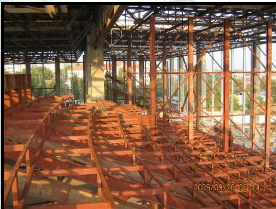
Montaj structura metalica cinematografe Sun Plaza Bucuresti (peste 400 t).