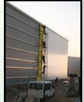
Hala fabricatie Szigetszentmiklós GARKONET UNGARIA