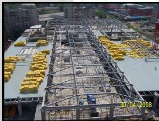
Montaj structura metalica acoperis Liberty Center Bucuresti - peste 700 t