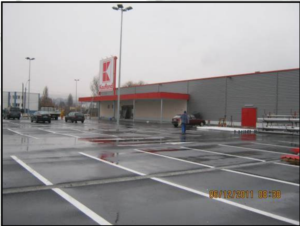
Realizare inchideri perimetrare magazin Kaufland Sfantu Gheorghe