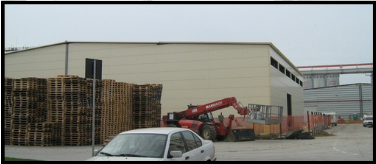
Montaj structura metalica si inchideri din panouri sandwich la fabrica de bere Ursus Timisoara - 2 hale - 250 t structura metalica