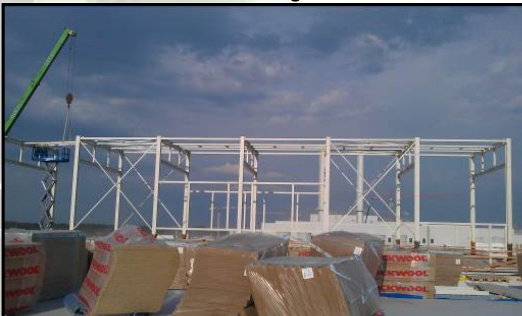
Montaj structura metalica penthouse hala G20 - Audi Győr Ungaria (peste 170 to)