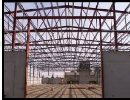
Montaj structura metalica depozit de cereale - Mezőhegyes UNGARIA