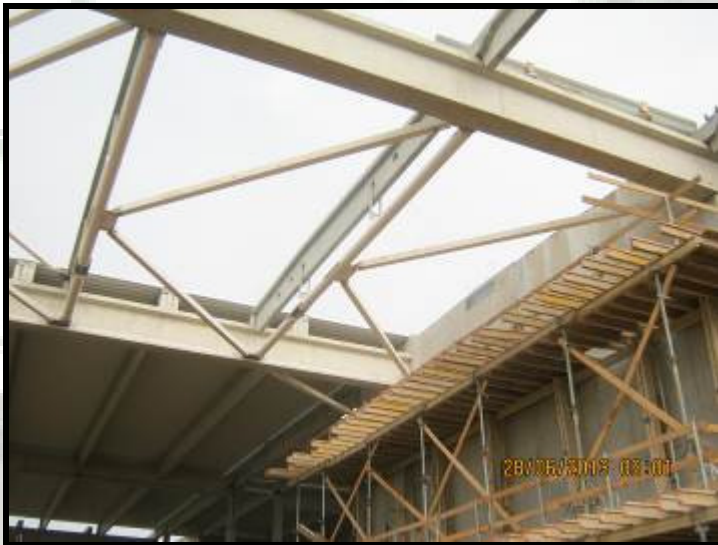
Montaj structura metalica Lego Nyíregyháza (peste 450 to)