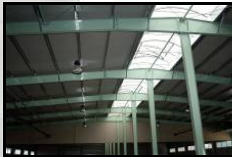
Hala depozite BorsoChem Kazincbarcika UNGARIA