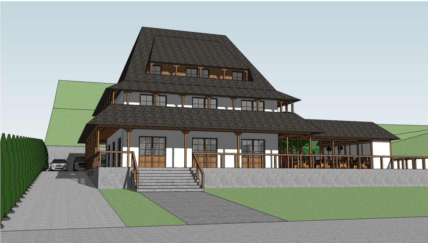
Proiectul realizat pastreaza elemente arhitecturale traditionale