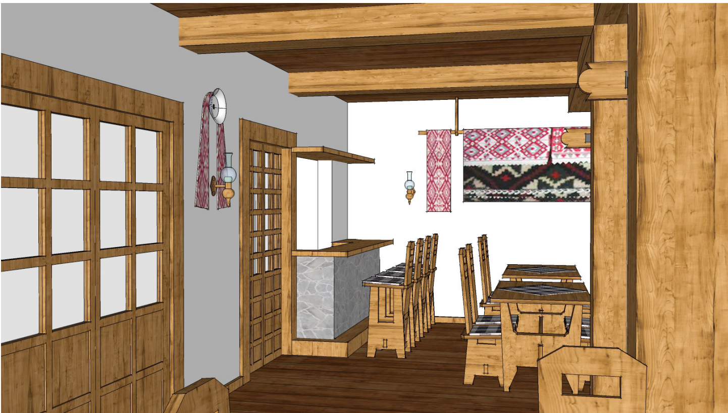
Zona de relaxare cu semineu si zona de bar