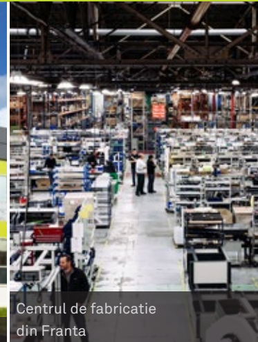
Centrul de fabricatie din Franta