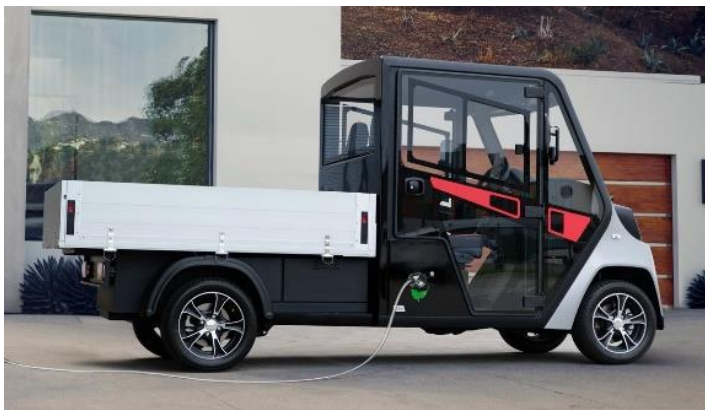
L (Long Chassis + 502mm extension)