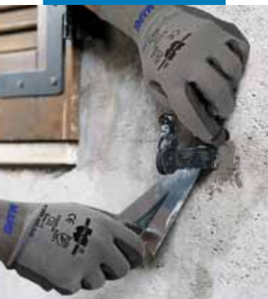
Fixarea balamalelor și elementelor metalice în zidărie folosind Lampocem