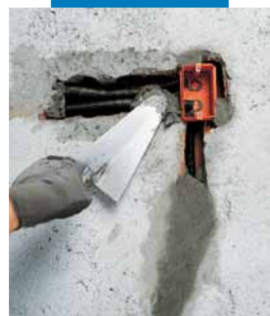
Fixarea dozelor și cimentarea traseelor pentru cablurile de instalații electrice folosind Lampocem