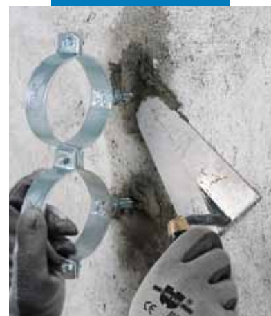
Fixarea colierelor metalice pentru susținerea țevilor folosind Lampocem