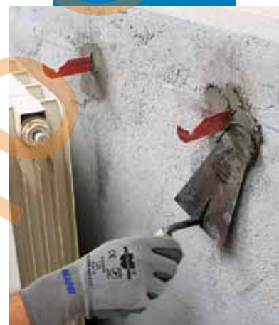
Ancorarea elementelor metalice pentru calorifere folosind Lampocem