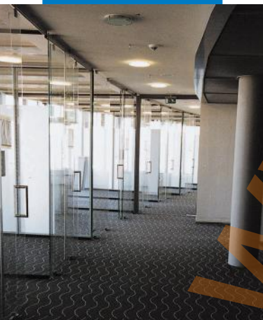
Montaj mochetă în Centul Poștal utilizând Ultrabond Eco Fix - Post Tower - Italia