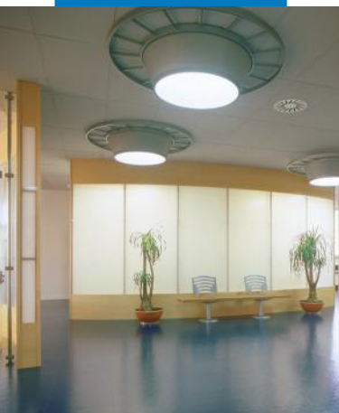
Exemplu de montaj pardoselă din dale de cauciuc utilizând Ultrabond Eco Fix - IBM Centre - Spania