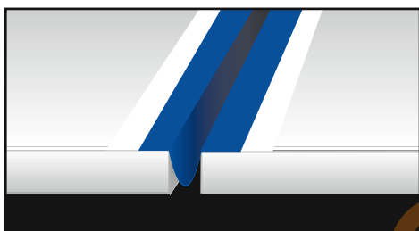
Poziționarea profilului Mapeband sub forma literei omega Ω, în interiorul unui rost de dilatare