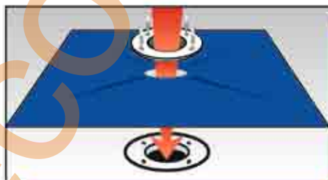
Poziționarea unei garnituri pentru impermeabilizarea și etanșarea elastică a sifoanelor de scurgere (piesa de 400 mm x 400 mm)