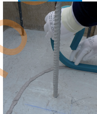
Aplicarea Idrostop Soft pe suprafețe orizontale

Toate referințele relevante despre acest produs sunt disponibile la cerere sau pe www.mapei.ro