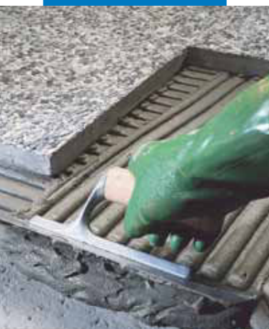
Montarea la exterior a plăcilor profilate de granit