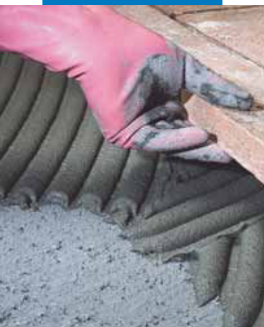
Montarea plăcilor de teracotă realizate manual, pe o suprafață neuniformă