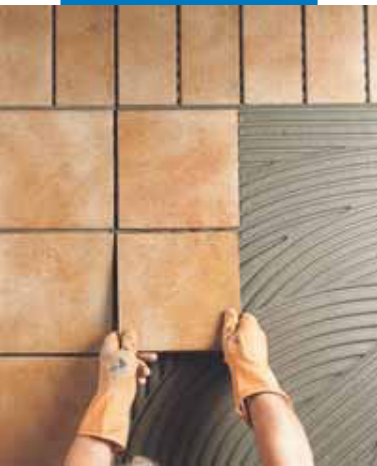
Montarea la exterior a plăcilor de klinker