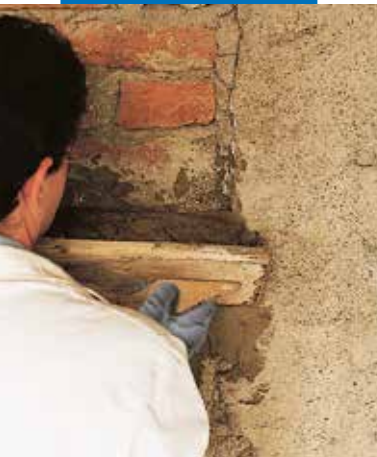
Refacerea unei zidarii vechi din caramida