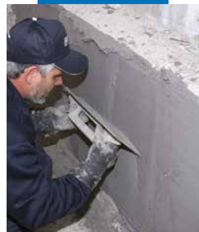
Aplicarea de Nivoplan cu spatula metalica