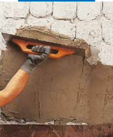
Nivelarea cu spatula lisa