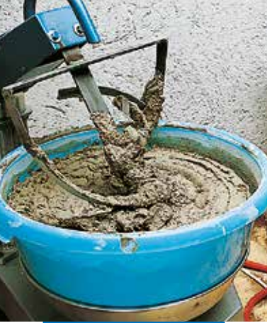
Pregătirea amestecului cu minibetoniera