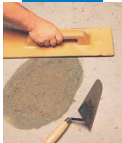
Reparatii localizate la pardoseli: finisarea suprafetei