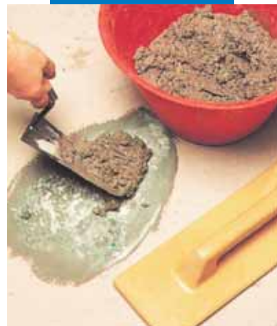
Reparatii localizate la pardoseli: aplicarea mortarului