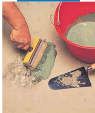
Reparatii localizate la pardoseli: aplicarea amorsei de aderenta