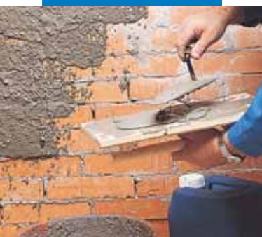
Aplicarea spritului adeziv aditivat cu Planicrete