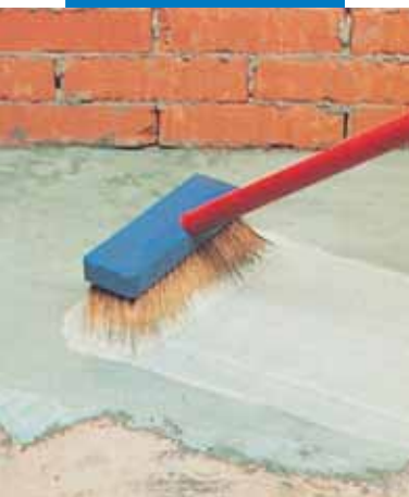
Aplicarea amorsei de aderență pe baza de ciment aditivată cu Planicrete