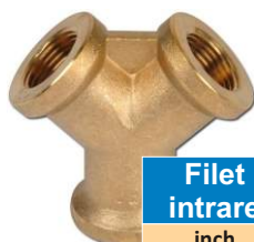
DISTRIBUITOR CU 3 CAI CU FILETE INTERIOR BSP

** Numai pentru cuplele din inox dotate cu supapa de inchidere si in cupla tata.