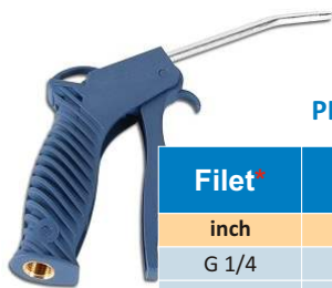
PISTOL AER DIN PLASTIC CU EXTENSIE LUNGA 140 MM