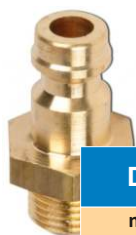
CUPLA PNEUMATICA TATA DN 7.2 CU FILET EXTERIOR BSP