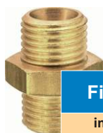
NIPLU DUBLU/TRECERE PNEUMATIC CU FILETE BSP SI CON ETANSARE 37°