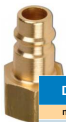
CUPLA PNEUMATICA TATA DN 7.2 CU FILET INTERIOR BSP

** Numai pentru cuplele din inox dotate cu supapa de inchidere si in cupla tata.