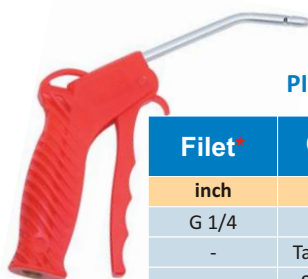
PISTOL AER DIN PLASTIC CU EXTENSIE LUNGA 100 MM

* Zona filetata este fabricata din alama si este incastrata in corpul pistolului. Diametru duza 2.0 mm.