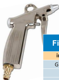
PISTOL AER DIN ALUMINIU CU DUZA SCURTA

* Zona filetata este fabricata din alama si este incastrata in corpul pistolului. Diametru duza 2.5 mm.