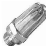
Duza scurta amortizor