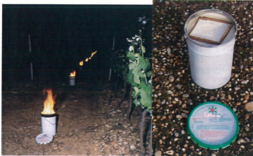
Fotografiile au caracter informativ