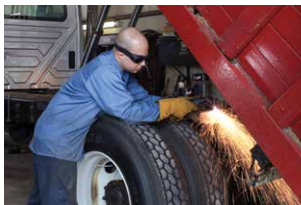
Reparații și modificări auto