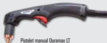
Pistol manual Duramax LT