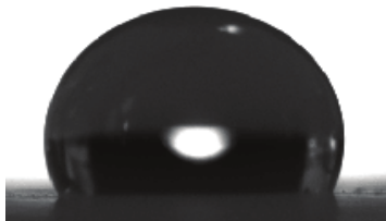
Picatura de apa pe suprafata vopsita cu SurfaPaint Aqua X Unghi de contact: 126°