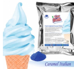
Praf de înghețată ALBASTRU - Caramel Italian (1300g / 5 L Lapte) 44.00lei