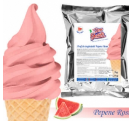
Praf de înghețată PEPENE ROȘU cu lapte (1300g / 5 L Lapte) 40.00lei