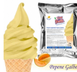
Praf de înghețată PEPENE GALBEN cu lapte (1300g / 5 L Lapte) 40.00lei