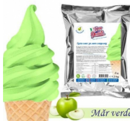
Praf de înghețată MĂR VERDE cu lapte (1300g / 5 L Lapte) 40.00lei