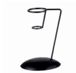
Stand pentru înghețată 40.00lei