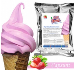
Praf de înghețată CĂPȘUNI cu lapte (1300g / 5 L Lapte) 40.00lei