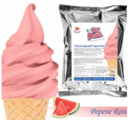
Praf de înghețată PEPENE ROȘU cu lapte (1300g / 5 L Lapte) 40.00lei