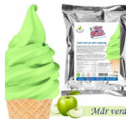
Praf de înghețată MĂR VERDE cu lapte (1300g / 5 L Lapte) 40.00lei