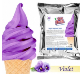
Praf de înghețată VIOLET cu lapte (1300g / 5 L Lapte) 44.00lei