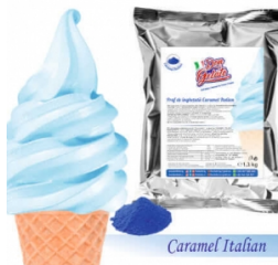
Praf de înghețată ALBASTRU – Caramel Italian (1300g / 5 L Lapte) 44.00lei