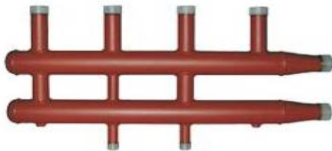
a. COLECTOR DISTRIBUTOR STANDARD