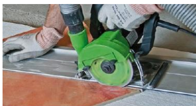
Linie ghidare taiere