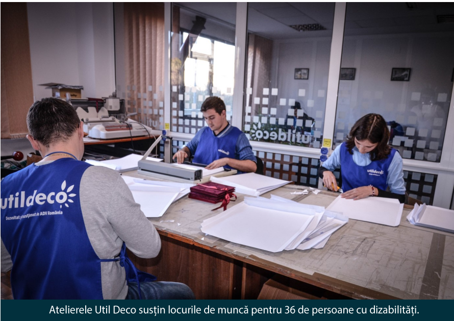
Atelierele Util Deco susțin locurile de muncă pentru 36 de persoane cu dizabilități.