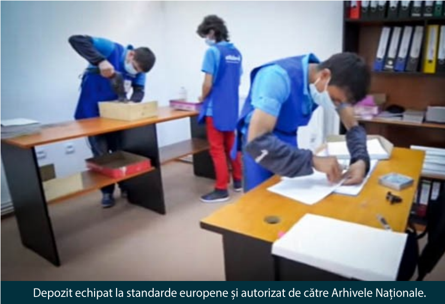
Depozit echipat la standarde europene și autorizat de către Arhivele Naționale.