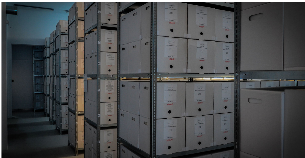
Servicii de arhivare și depozitare