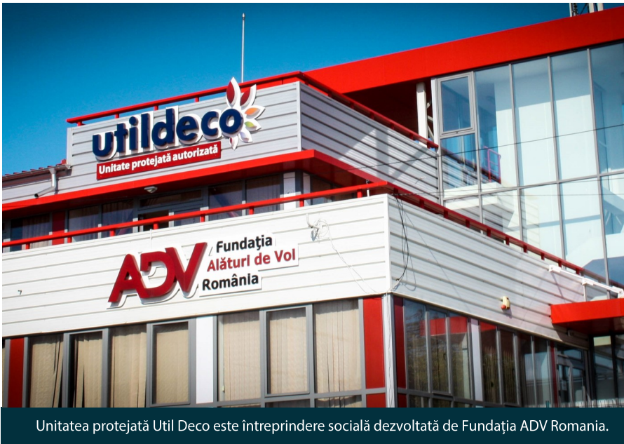
Unitatea protejată Util Deco este întreprindere socială dezvoltată de Fundația ADV România.