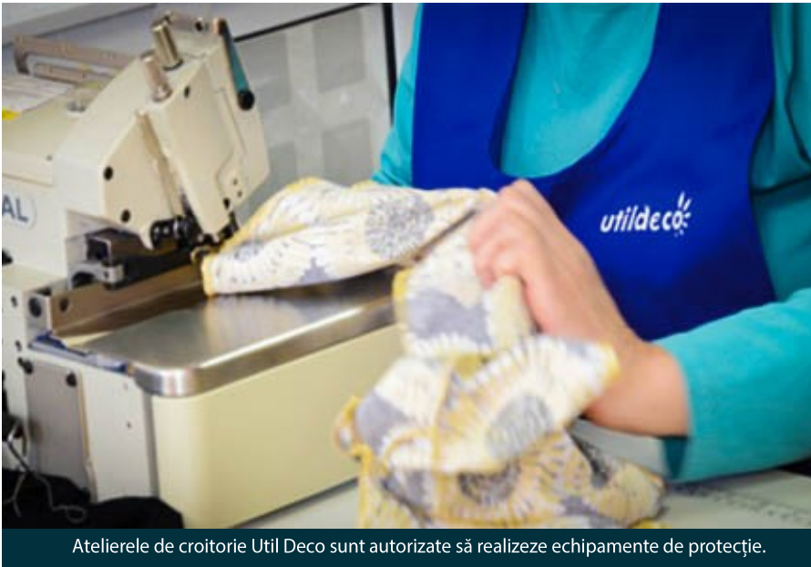
Atelierile de croitorie Util Deco sunt autorizate să realizeze echipamente de protecție.