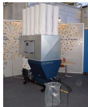
Filtru cu maneci