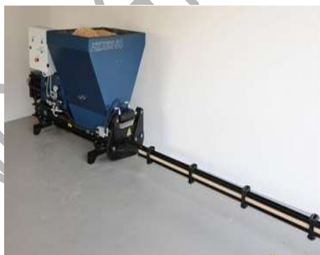
Serpentina de racire extinsa: 3.000 mm