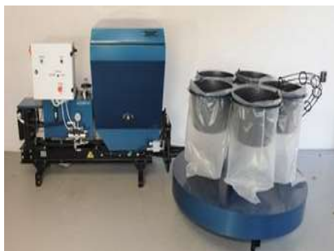
Carusel pentru 5 saci.