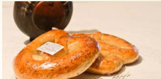
covrig cu sare și susan