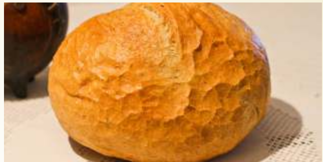
pâine semi-albă nefeliată