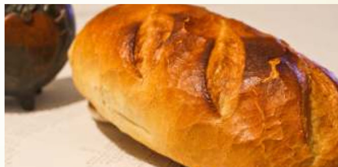
pâine albă nefeliată