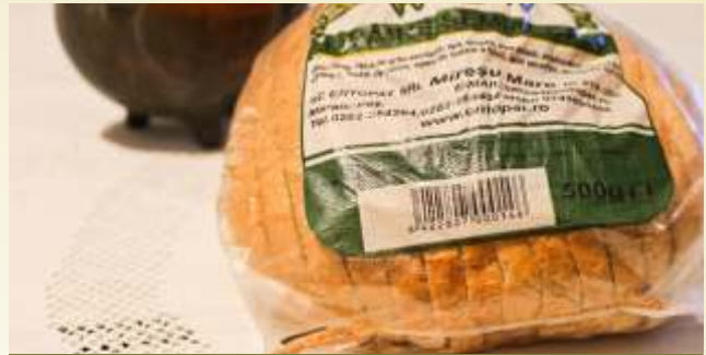
pâine semi-albă feliată