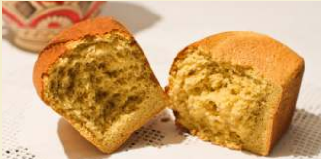
pâine de mălai