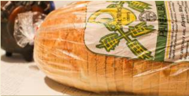
pâine albă feliată