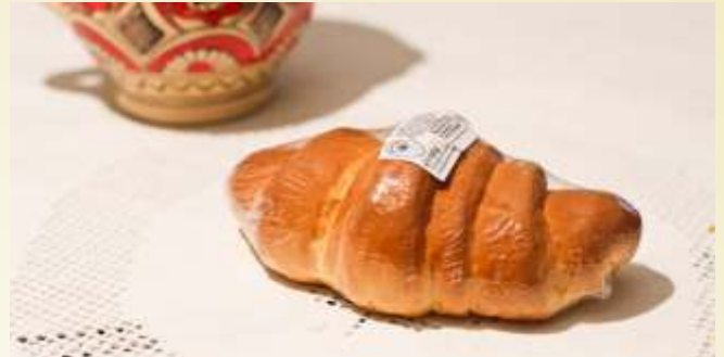
corn cu ciocolată