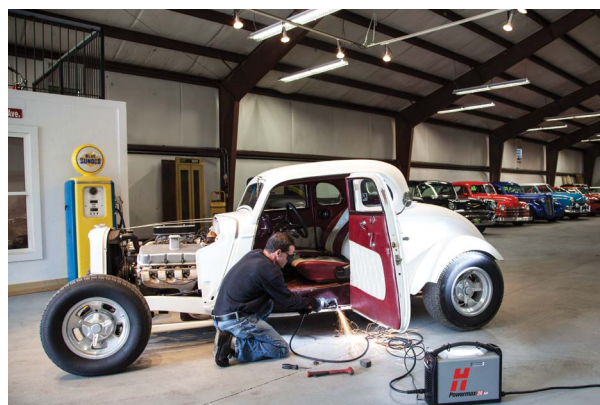
Reparații și modificări auto