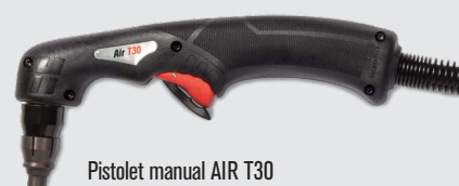
Pistolet manual AIR T30