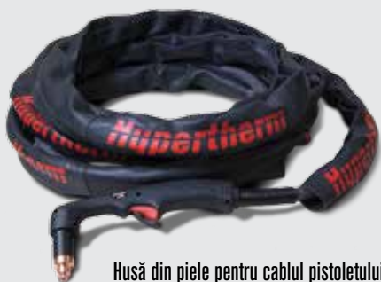
Husă din piele pentru cablul pistolului