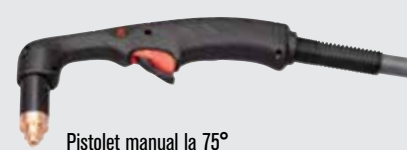
Pistolet manual la 75°

(pentru mai multe tipuri de pistolete, consultați www.hypertherm.com )