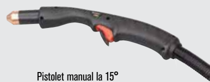
Pistolet manual la 15°