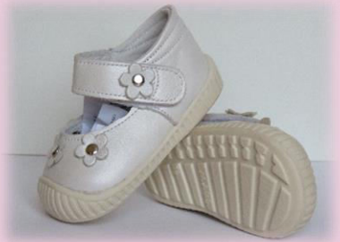
COD: Z26 ALB