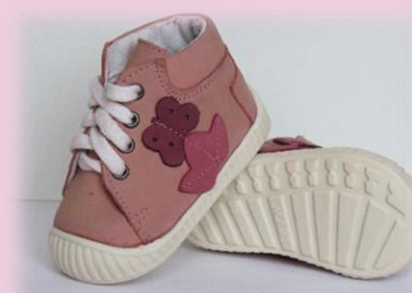
COD: ZI17 ROZ DESCHIS