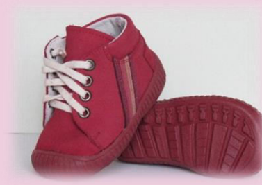
COD: ZI4CCCS RASBERY