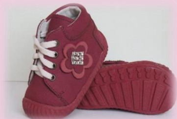
COD: ZI4CSV BORDO