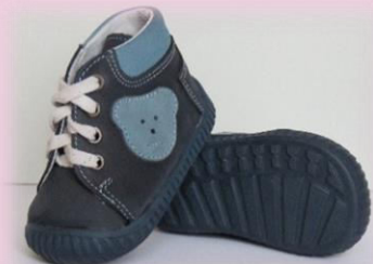
COD: ZI4M ALBASTRU