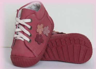
COD: Z14VVV ROZ INCHIS