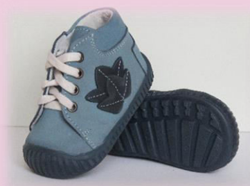
COD: ZI4 ALBASTRU DESCHIS