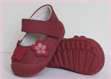
COD: Z226 BORDO