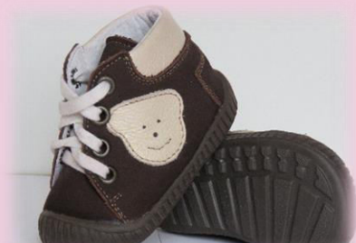
COD: Z14M MARO-BEIGE