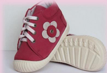
COD: Z14 UPV