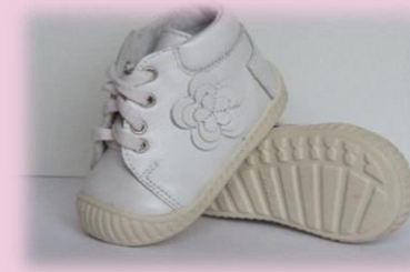
COD: Z214 ALB