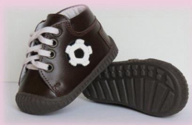
COD : Z14 F