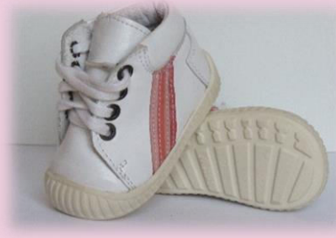
COD: ZI4CCCS ALB