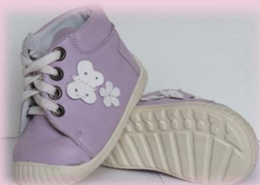
COD: ZI4UP LILA