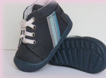
COD: ZI4CCCS ALBASTRU