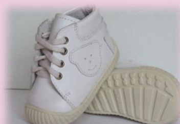
COD: Z214 ALB