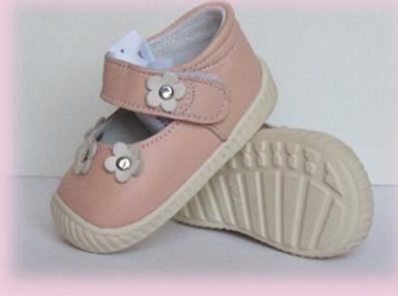
COD: Z26 ROSE