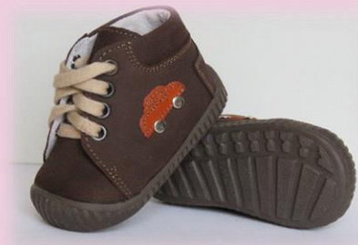
COD: Z118 MARO