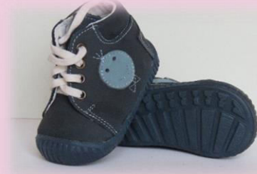
COD: ZI14 ALBASTRU