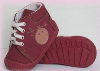
COD: ZI16 BORDO