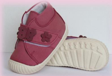
COD: Z13 PUP